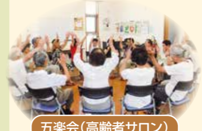
五楽会(高齢者サロン)