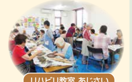
リハビリ教室 あじさい