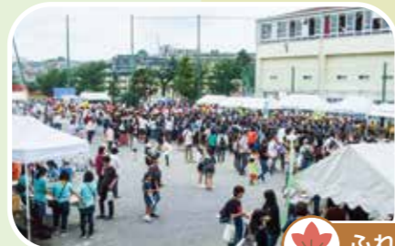
ふれあいフェスタ