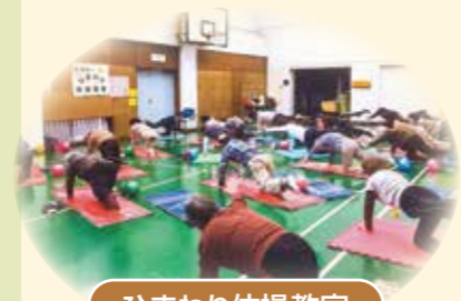
ひまわり体操教室