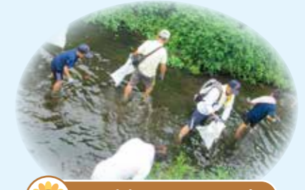
日野川クリーンアップ