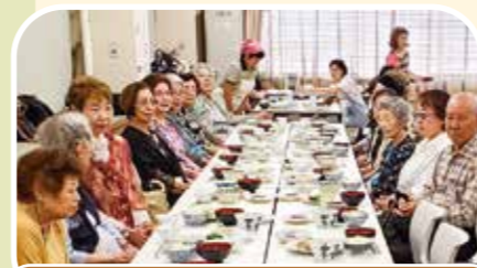
麻の会(一人暮らし高齢者食事会)