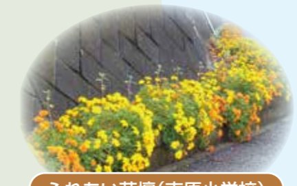
ふれあい花壇(吉原小学校)