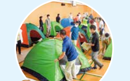
地域防災拠点訓練