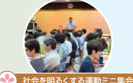
社会を明るくする運動ミニ集会