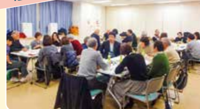
まちの課題を共有し、より良いまちづくりについて話し合います