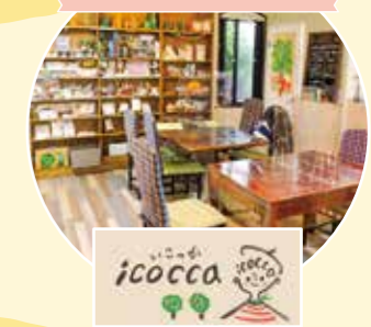
赤ちゃんも高齢の方もみんなで集うコミュニティカフェ