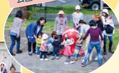
未就学児と保護者が集まったこちゅう公園で外遊びの会をしています