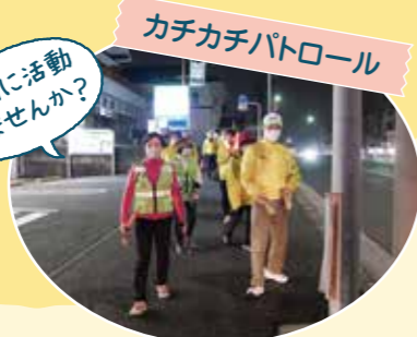
みちの会(防犯ボランティア)がまちの安全、防犯の見守りをしています