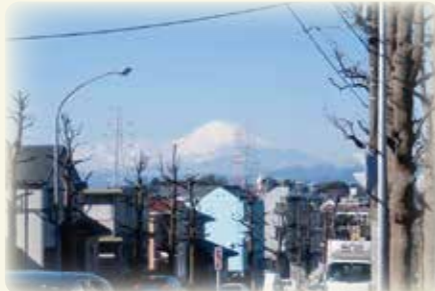
環状3号線から富士山を臨む

日野南地域支えあいネットワーク連絡会は、地域の団体で構成され、住民相互の心と力を結びつける役割を担っています