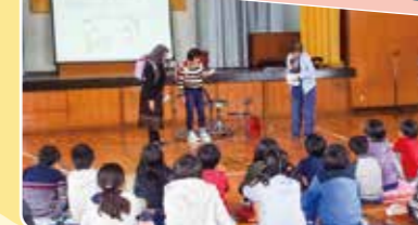
地域の方や小中学生に認知症の理解を広げる取り組みをしています