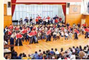
小学校と地域の様々な団体が協力して行われる冬のイベント