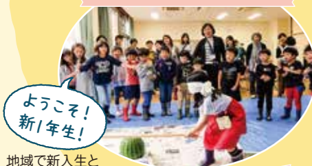
ようこそ! 新1年生! 地域で新入生と保護者を歓迎します