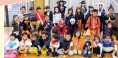
季節の行事で子どもたちに楽しい思い出づくりを!