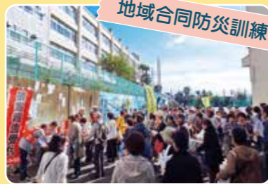
小学校とも連携し、子どもを含め多くの人参加します