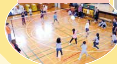
みんなでスポーツ!! 世代を超えて一緒に汗を流そう