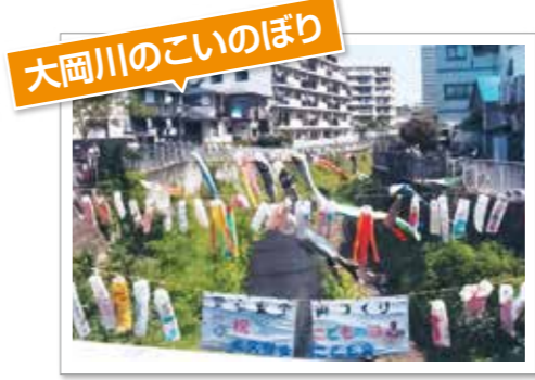
大岡川のこいのぼり