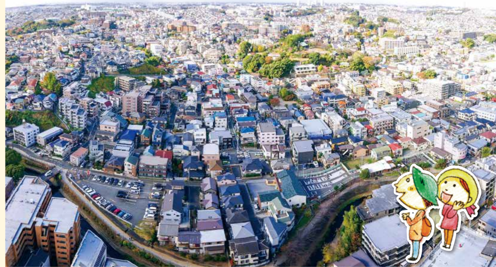
写真:上大岡の高層ビルより大久保最戸方面を臨む(右上の大きな緑地が神奈川県戦没者慰霊堂)