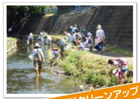
大岡川クリーンアップ