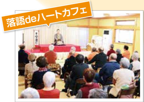
落語deハートカフェ