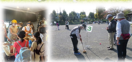
補助金交付団体 活動の様子