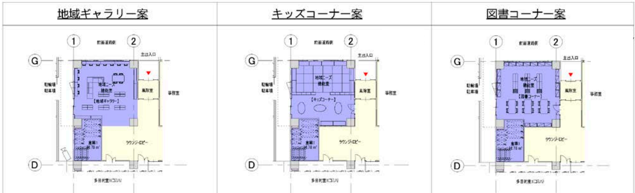
▲地域ニーズ機能室案

また、コミュニティハウスの地域ニーズ機能室にどのような機能を持たせるかについて、事務局から3案提示し、委員の皆様からご意見をいただきました。