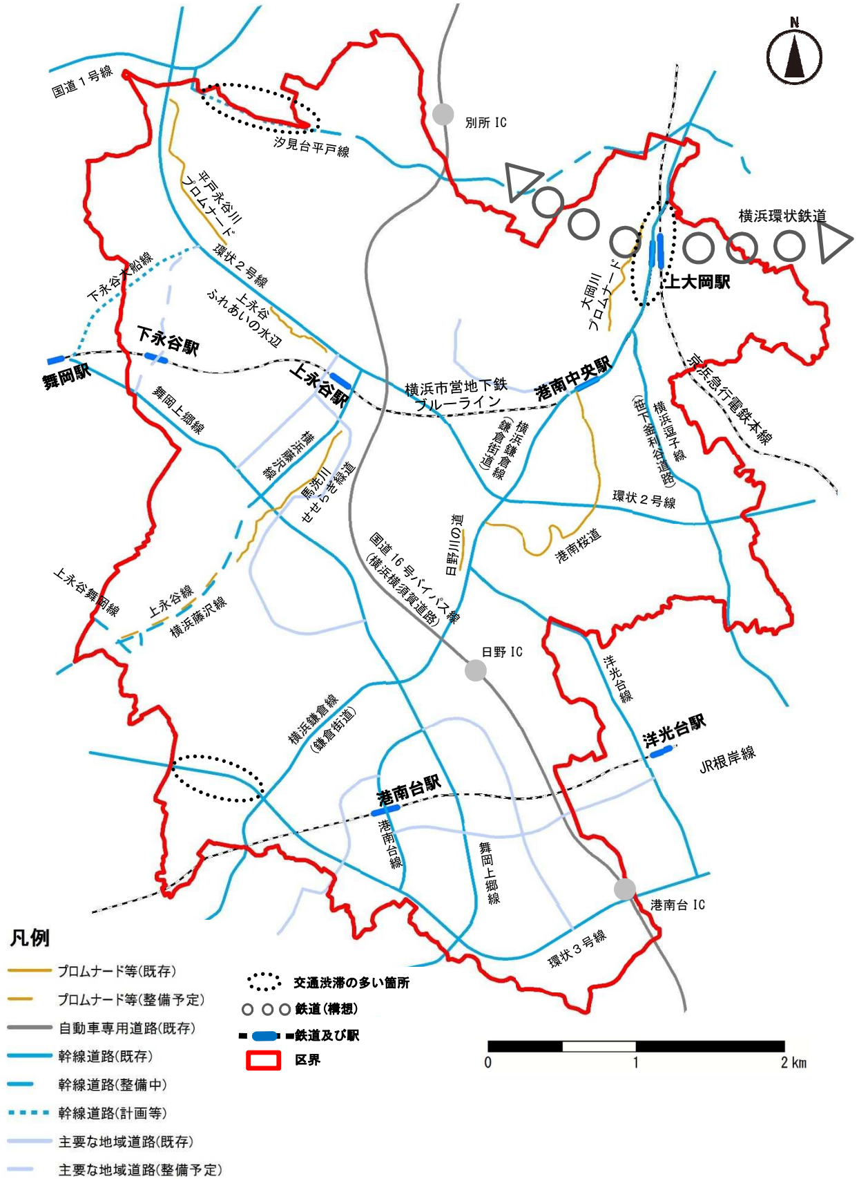
図 都市交通の方針図