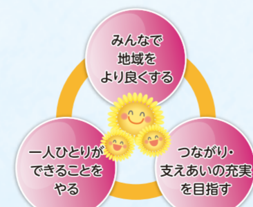
港南ひまわりプラン

区制50周年を契機に地域・学校・事業者の皆さまとのつながりが一層深まりました。この機運を持続させるとともに、「第3期港南ひまわりプラン（地域福祉保健計画）」の推進と次期プランを地域の皆さまと一緒に作りあげていく過程を通じて、地域の中で見守り、支えあい、誰もが生き生きと暮らしていくことができる協働による地域づくりを進めます。