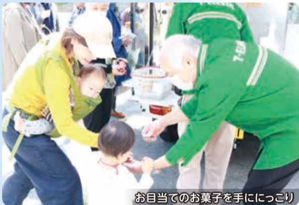
お目当てのお菓子を手ににっこり