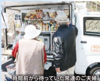
時間前から待っていた常連のご夫婦