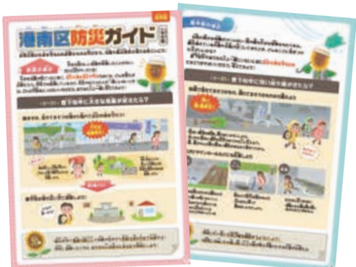
防災ガイド(小学生編)

避難所での生活はスペースやプライバシーの確保が難しいため、ストレス等により体調を崩してしまう人もいます。できる限り住み慣れた自宅で被災生活をおくるために、家具の転倒防止や火災防止のための感震ブレーカー、トイレパックなどを準備しておきましょう。