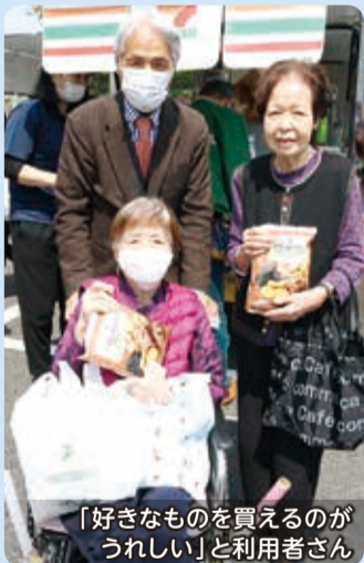
「好きなものを買えるのがうれしい」と利用者さん