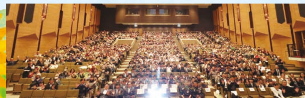
元気な地域づくりフォーラム