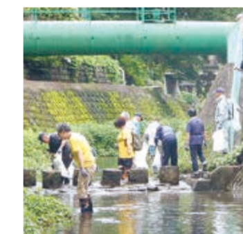
日野川クリーンアップ