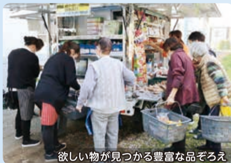
欲しい物が見つかる豊富な品ぞろえ