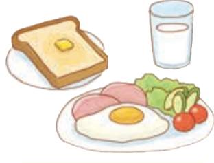
バランスよく食べる