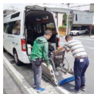
「港南〇〇たい」による移動支援

また、医療・介護・介護予防・生活支援等が一体的に提供される地域包括ケアシステムの構築を進めます。