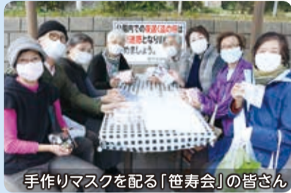
手作りマスクを配る「笹寿会」の皆さん