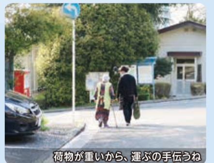
荷物が重いから、運ぶの手伝うね