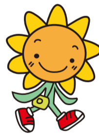
港南区ウォーキング推進キャラクター ひまわりくん

「健康アクションこうなん5」の実践を呼び掛け、誰もが健やかに、健康寿命を延ばす取組を進めます。