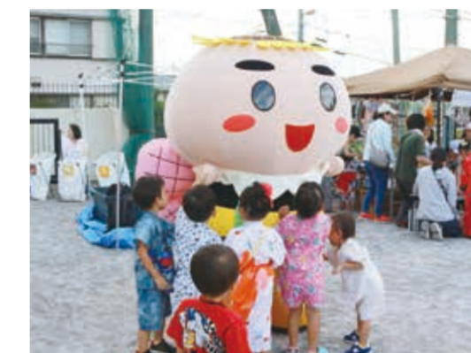
港南ひまわり83運動PRの様子