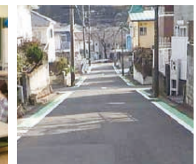
通学路の安心カラーベルト

*「Sustainable Development Goals (持続可能な開発目標)」の略で、「誰一人取り残さない」を基本理念とする国際目標