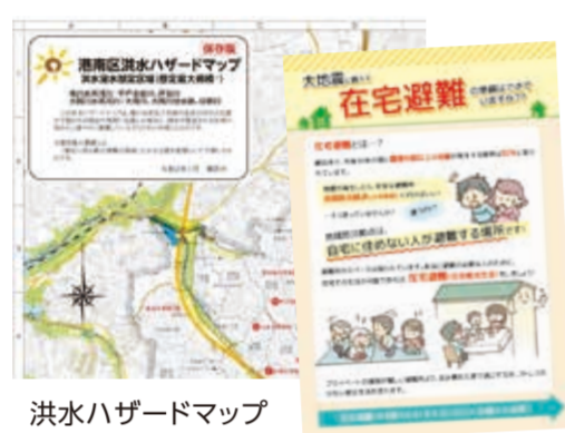
洪水ハザードマップ