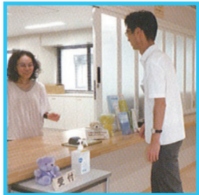
受付・待合スペース