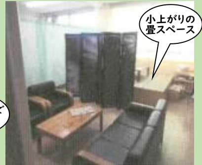
小上がりの畳スペース