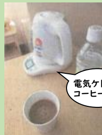
電気ケトルでコーヒーも。

～昨年度永田中ブロックでは働き方について3校で協議～ 【今年度から3校共通で】休憩スペースをきちんと確保 【永田中学校】1階職員室の休憩スペースの他に、 職員室から離れた教室の近くに休憩室を設置 ⇒先生方が、授業の合間に“ほっと一息”できる空間に ⇒休憩室の環境整備は、技術員さんが協力 (チームを支えています)