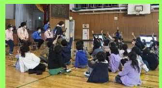
福祉作業所との交流会の様子

令和3年度は「ワックスがけ」がどういった業務なのかを障害者就労施設に知ってもらうため、市内4校で見学会を実施しました。令和4年度からは、さらに多くの障害者就労施設がワックスがけの技術を取得し、学校現場の外部委託に繋がるよう、2年間かけてモデル事業を実施していきます。 今後も学校業務の外部委託を推進 していきます。