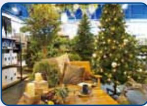
11月から店内はクリスマスモードに! ディスプレイは撮影もOK

特典 ぐるっとVol.3ご持参で2,000円以上お買い上げでお会計から500円引き