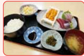
お刺身に箱ウニがついた「刺身定食B」は一番人気のメニュー(1,300円・税込)

多彩な魚料理を楽しめる、横浜市中央卸売市場本場内の定食屋さん。毎日新鮮なお魚を仕入れています。