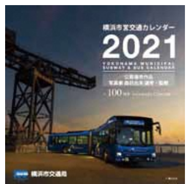
2021年カレンダー表紙