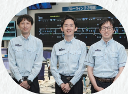
交通局総合司令所 2013年～2014年度入局

自分の子どもが「お父さんは横浜市交通局で働いているんだ」と友達に誇ってくれるような交通局であり続けたいです。未来の世代が市営交通を支えてくれるといいですね。