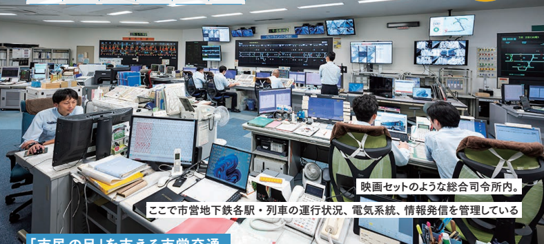
映画セットのような総合司令所内。