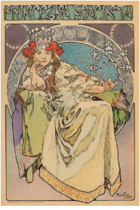
ポスター《ヒヤシンス姫》 1911年

オール・ヌーヴォーを代表する作家、アルフォンス・ミュシャ(1860～1939)の多彩な芸術活動に焦点を当てた展覧会を開催いたします。チェコ在住の個人コレクター・チマル博士のコレクションから、初来日作品92点を含む約170点の作品をお楽しみください。 会期：2024年11月23日(土・祝)～2025年1月5日(日) *無休 会場：そごう美術館(そごう横浜店6階) 時間：10:00～20:00 *入場は19:30まで 料金：一般1,400(1,200)円、 大学・高校生1,200(1,000)円、中学生以下無料 *( )内は前売、各種プレイガイドの料金 アクセス：ブルーライン 横浜駅出口3から徒歩約10分 お問合せ：☎045-655-5515 代表的なポスター作品だけでなく、貴重な直筆の作品58点をはじめ、お菓子や香水のパッケージ、宝飾品など多彩なミュシャ芸術の魅力をご紹介します。