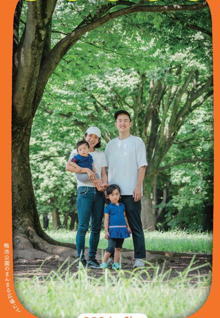
鴨池公園のまんまる丘公園