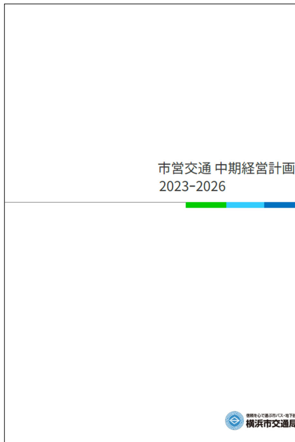
図—2 市営交通中期経営計画 2023-2026