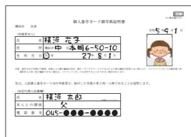
□顔写真証明書記入例