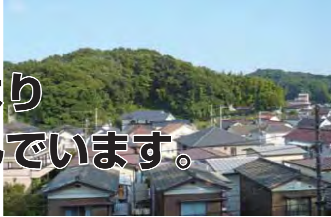
平成22年度に指定された鍛冶ヶ谷特別緑地保全地区（栄区）