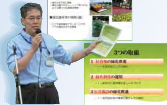
松壽課長による説明

また『緑化制度の運用』では、建築・開発行為の際に、どのように緑化を推進しているのか、『公共施設の緑化推進』では、『公共施設緑化事業』による校庭や園庭の芝生化などについての話がありました。