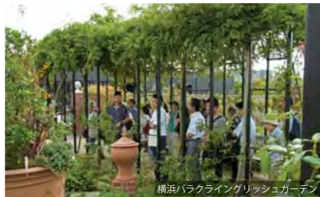
横浜バラクライングリッシュガーデン

株式会社 t v k コミュニケーションズ t v k ecom parkゼネラルマネージャー代表取締役 ecomカンパニー 社長執行役員