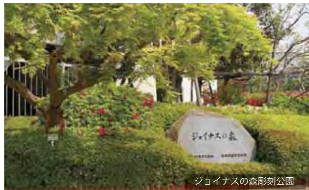
ジョイナスの森彫刻公園