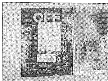
表紙のアイドルの写真が切り取られた雑誌

図書館をご利用になるすべての方にルールやマナーを守っていただけるよう、来年度以降も、ポスター等の掲示やキャンペーンを通して働きかけを行っていきます。