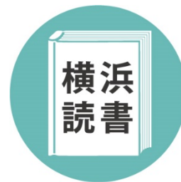
読書活動ロゴマーク