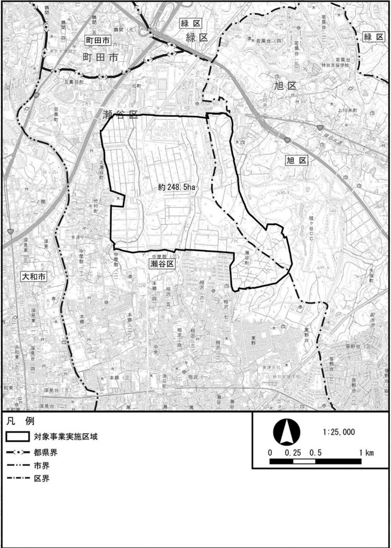
図 1.1-3 対象事業の規模