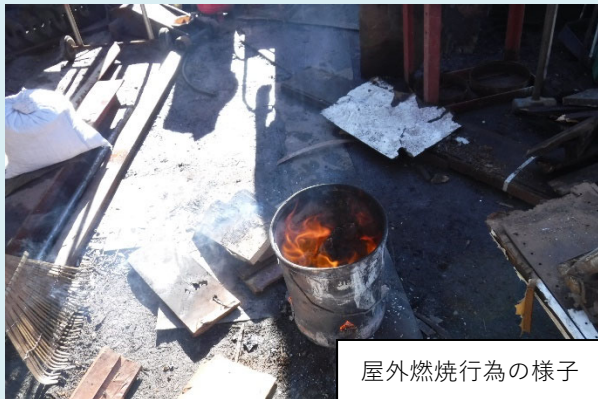
屋外燃焼行為の様子

屋外燃焼（野焼き）は原則禁止となっていますが、例外的に制限がかからない行為もあります。そのような行為であっても、市に相談が寄せられた際は、現地調査の上、焼却物を十分に乾燥させる、風向きに注意するなど行為者に配慮要請を行っています。