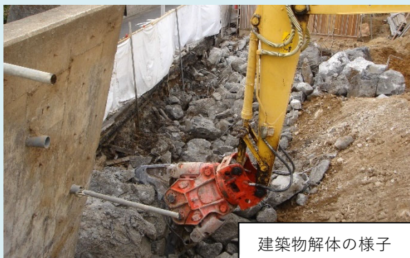
建築物解体の様子

建設作業の振動苦情では、騒音苦情と同様に迅速な対応をするとともに、振動を発生させる機材を長時間連続して使用しないなど、近隣に配慮した作業をするよう事業者へ指導しています。