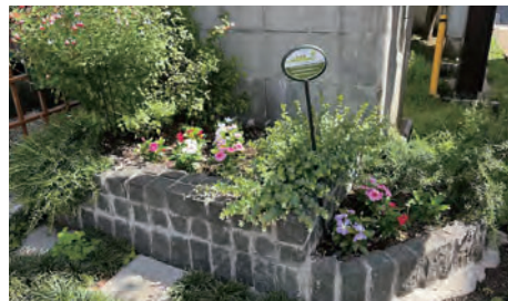
石を組んで作られた花壇