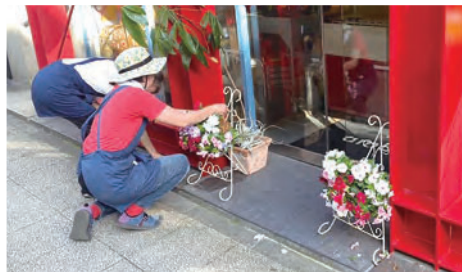
店舗にハンギングバスケットを設置