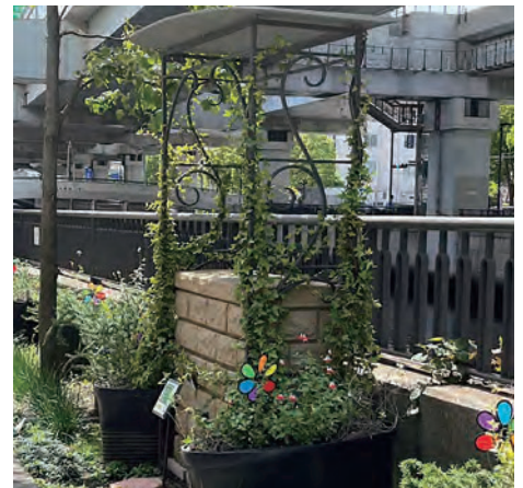
オリジナル屋根付きパーゴラ雨水貯水タンク