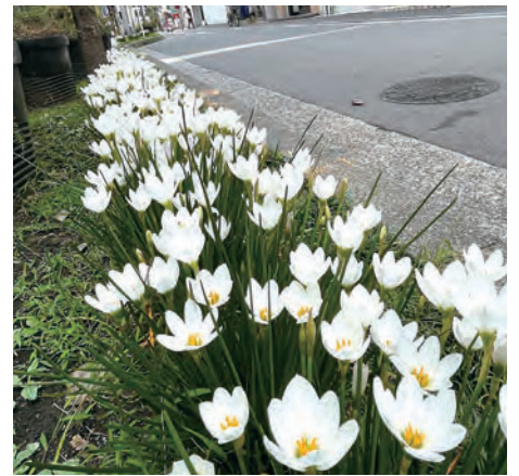
整備された「タマスダレ」