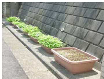
B-2 プランター、鉢設置