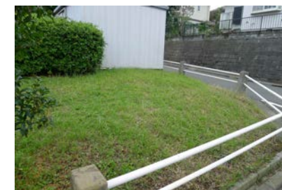
大上第一公園 花壇候補地