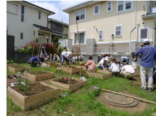
ふれあい花壇 作業風景