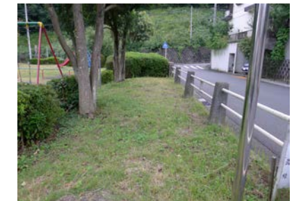
大上第二公園 花壇候補地