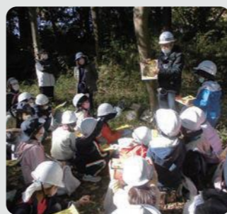
森づくり活動団体への支援(磯子区)

保全した市管理の樹林地を良好かつ安全に維持管理するとともに、森づくり活動団体に対する支援や、民有樹林地所有者に対する維持管理費用の一部助成を行いました。