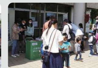
緑や花を身近に感じる各区の取組(鶴見区)