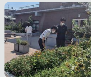
港北区庁舎(港北区)