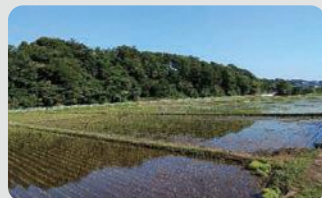
水田の保全(戸塚区)

市内の水田面積の約9割を保全し、農地縁辺部の草刈りや植栽等により良好な農景観を維持・形成しました。