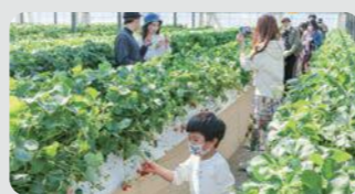
収穫体験農園(神奈川区)