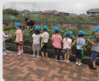
農園付公園(瀬谷区)