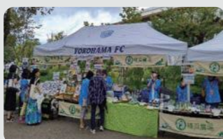
横浜FCホームゲームにおける地産地消イベント(神奈川区)