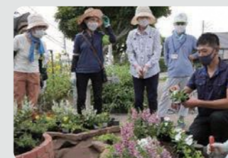
地域の花いっぱいにつながる取組(栄区)

オープンガーデンなどの市民が緑や花に親しむ取組を各区で推進しました。併せて、取組の成果をガーデンネックレス横浜の中で発信し、市民や地域・企業等の関心の高まりへとつなげました。