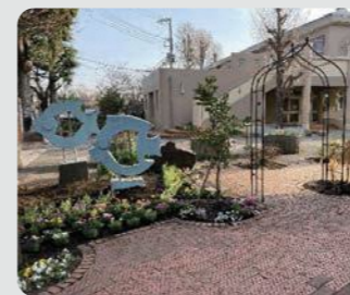
小学校の花壇整備(南区)