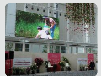
横浜市役所アトリウムでのPR動画放映