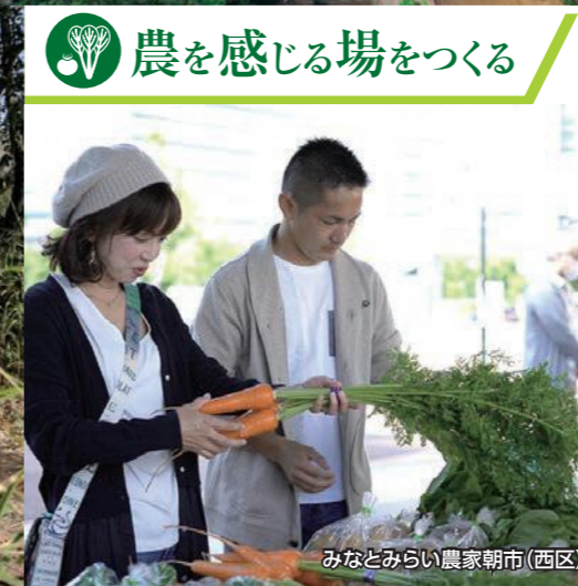
みなとみらい農家朝市(西区)