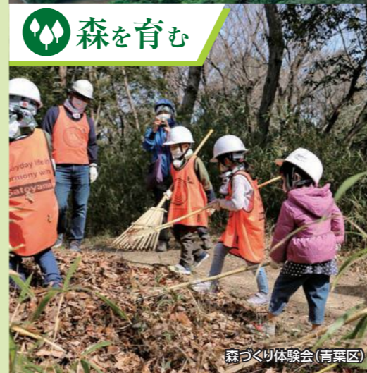
森づくり体験会(青葉区)