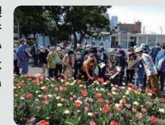
市民連携花壇講座(中区)

山下公園で市民参加の球根ミックス花壇の講習会を行うとともに、市内の1,000か所を超える公園で市民による花壇づくりを展開しています。