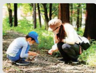
よこはま森の楽校(緑区)

コロナ禍で身近な自然にふれあうニーズが高まる中、外出の機会が減った子どもたちが参加できる自然の中でのびのびと過ごす森のイベントを多く開催しました。