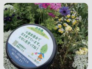
公園花壇での現地表示プレートの設置