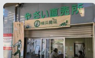
青空市・マルシェ等(磯子区)