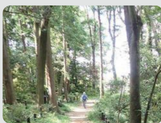
上川井市民の森(旭区)