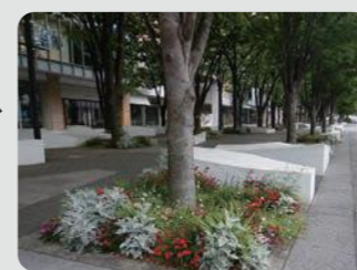
グランモール公園(西区)