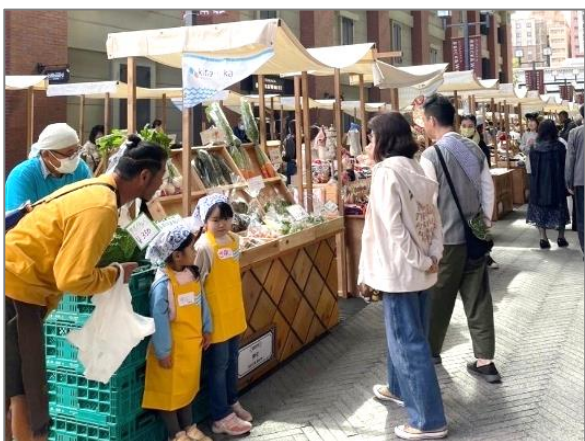
14 青空市・マルシェ等 （横浜北仲マルシェ）