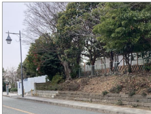
19 シンボリックな緑の創出・育成 （山手町（整備中））