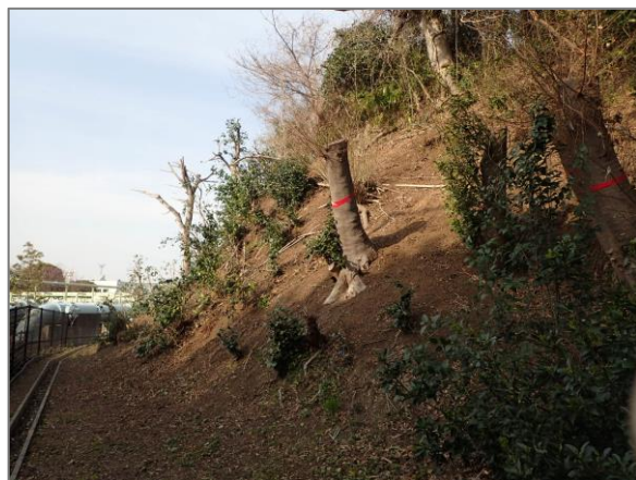
2 森の維持管理 （本牧十二天緑地）