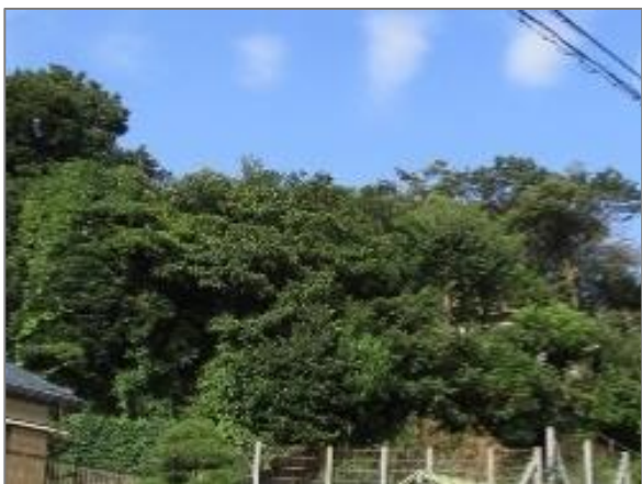
1 緑地保全制度による新規指定 緑地保存地区（本牧町）