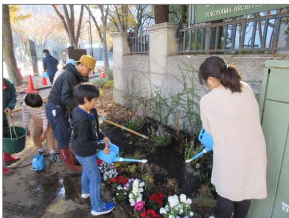
23 地域に根差した緑や花の楽しみづくり （開港広場公園）