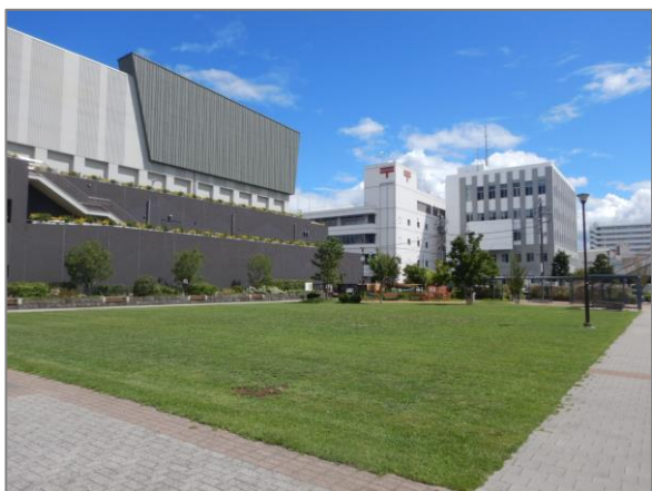
17 公共施設・公有地での緑の創出・育成 (泥亀公園)