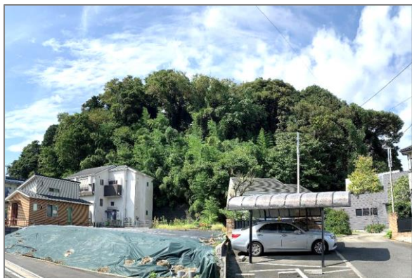
1 緑地保全制度による新規指定 (富岡東三丁目特別緑地保全地区)