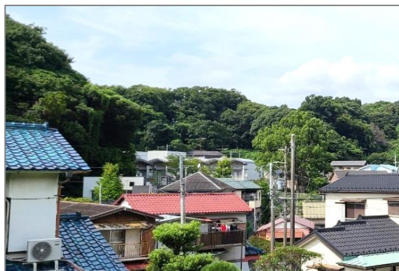
1 市による買取り (富岡東三丁目特別緑地保全地区)