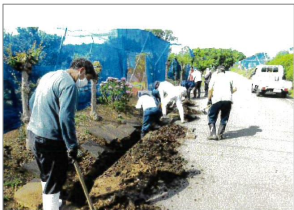
10 農景観を良好に維持する活動 (柴農業機械利用組合)