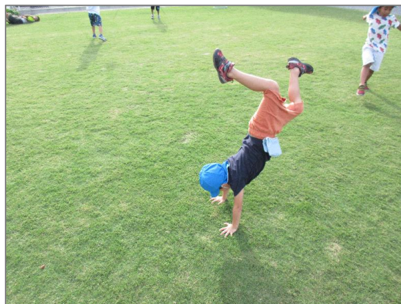
25 保育園での緑の創出・育成 (区内保育園)