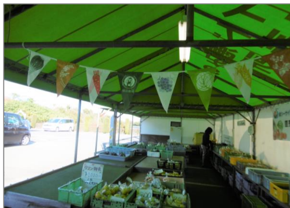
14 青空市・マルシェ等 (柴シーサイド恵みの里直売所)