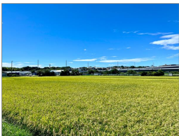
8 水田の保全 （市ヶ尾町）