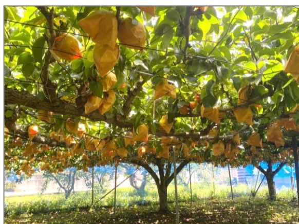
12 収穫体験農園の開設 （寺家町）