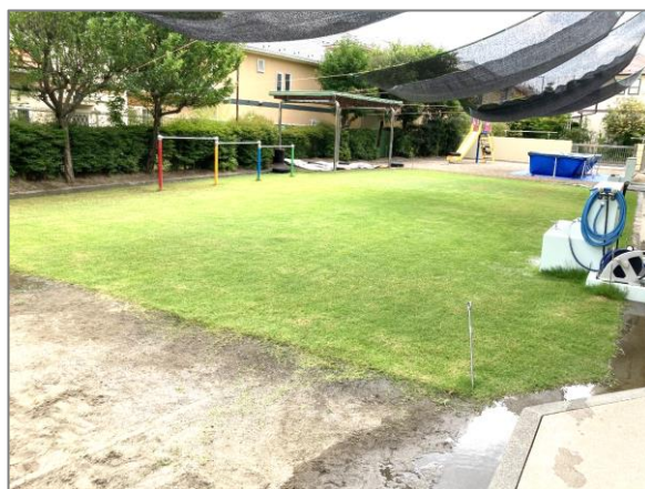
25 保育園での緑の創出・育成 （区内保育園）