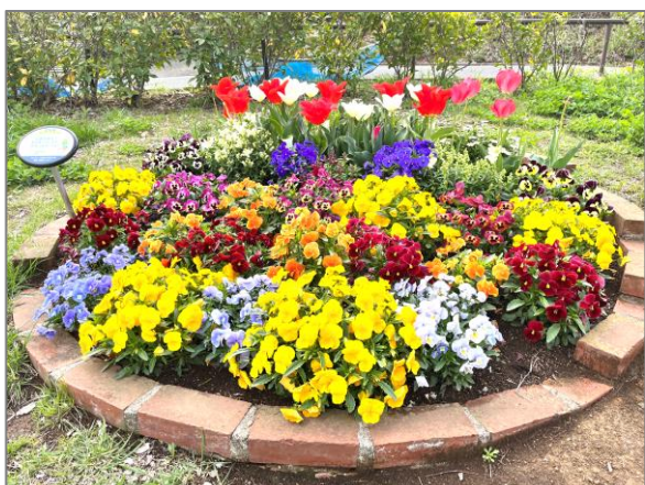
23 地域に根差した緑や花の楽しみづくり （美しが丘西滝の沢公園）