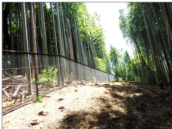
1 保全した樹林地の整備 （元石川町平崎特別緑地保全地区）