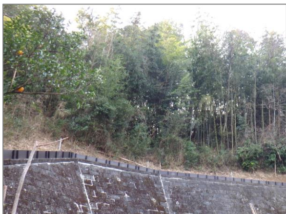
1 緑地保全制度による新規指定 源流の森保存地区（奈良町）