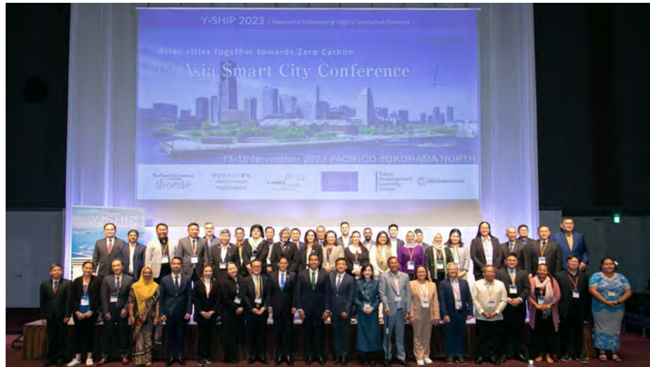
<国際コンベンションY-SHIP>