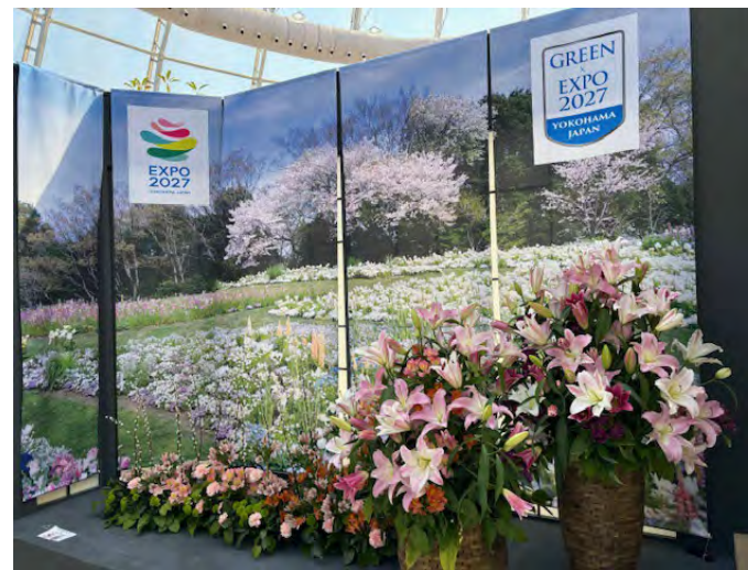
<ドーハ国際園芸博覧会の日本国出展>