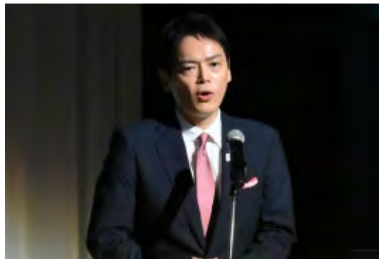
<市長による主催者挨拶>