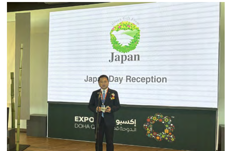
<ジャパンデーレセプションでの挨拶>