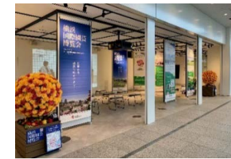
&lt;プレゼンテーションスペースでのPR&gt;