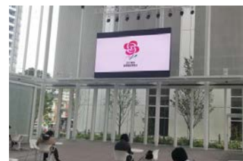
&lt;アトリウムでの放映&gt;

また、環境創造局が実施しているガーデンネックレス横浜のローズウィークと連携し、5月12日から24日までの間、市庁舎2階プレゼンテーションスペースでパネル等の展示、PR動画及び有識者インタビュー動画の放映、チラシ・ノベルティグッズの配布を行いました。