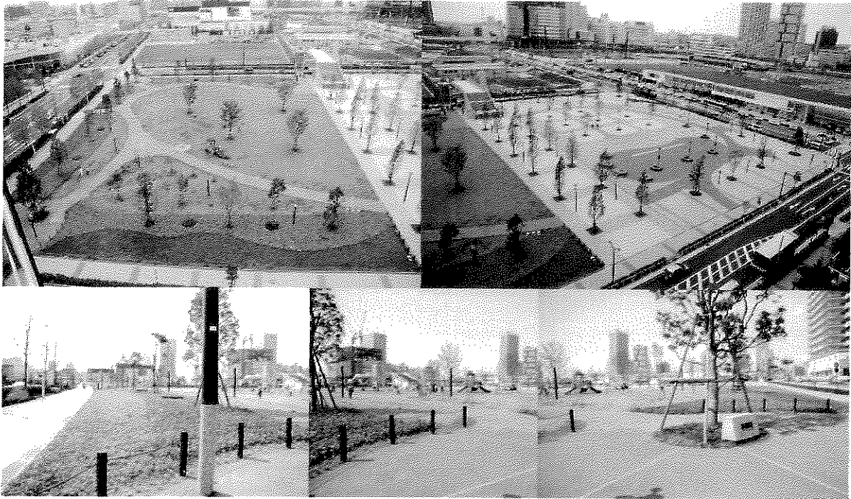
高島中央公園 現況