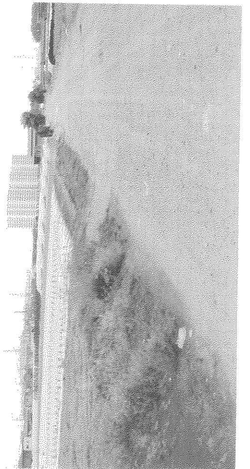
三樓台小差 三樓台小差