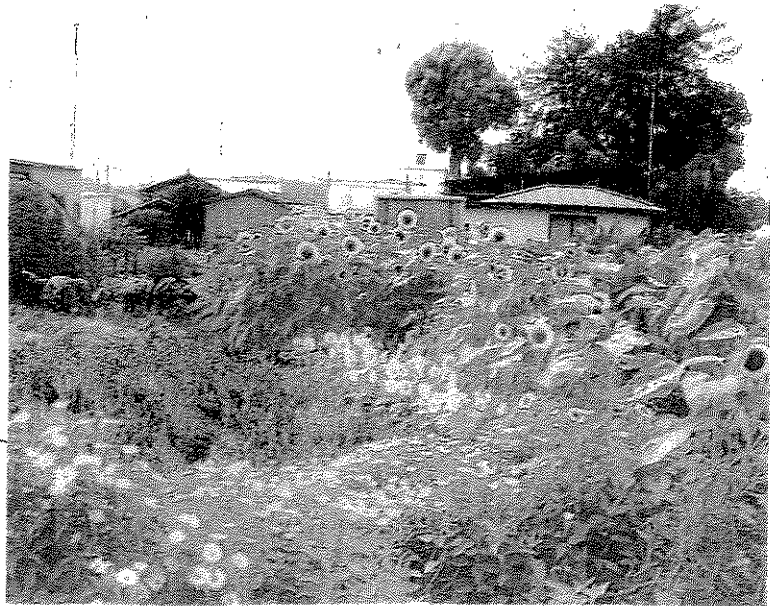
～ 有機野菜を使ってお弁当・染(い)いときー (デザインサービス)