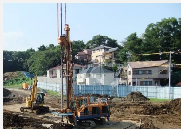
地盤改良施工状況