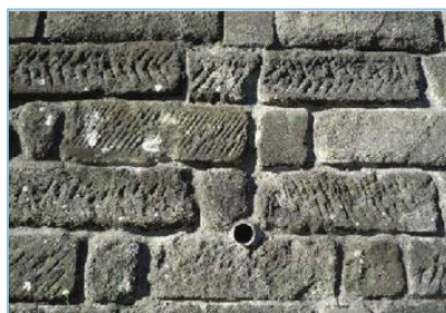
グラブ積擁壁の利活用