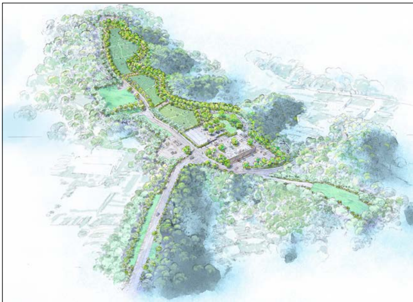
北側からの鳥瞰イメージ