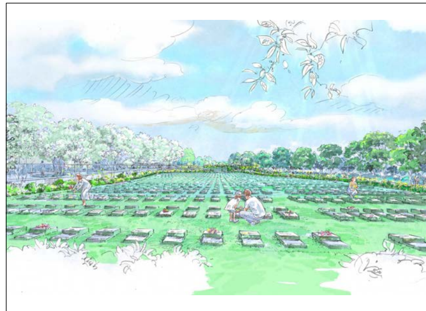
芝生型納骨施設イメージ