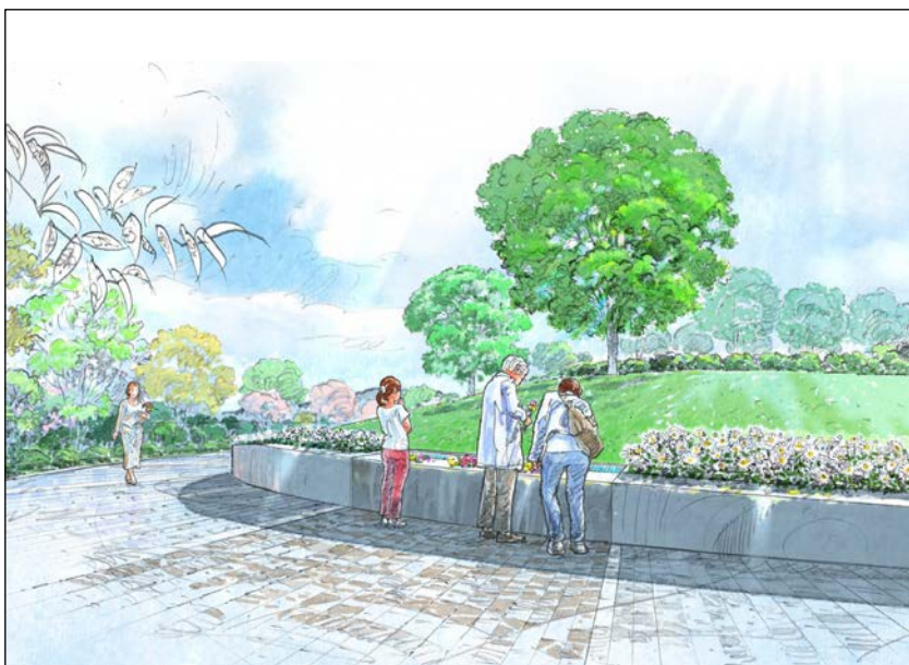
合葬式樹木型納骨施設イメージ