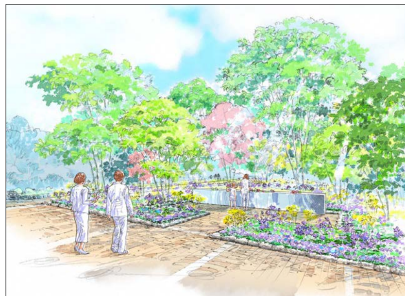
合葬式樹林型納骨施設イメージ