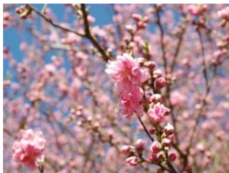
「ハナモモ」