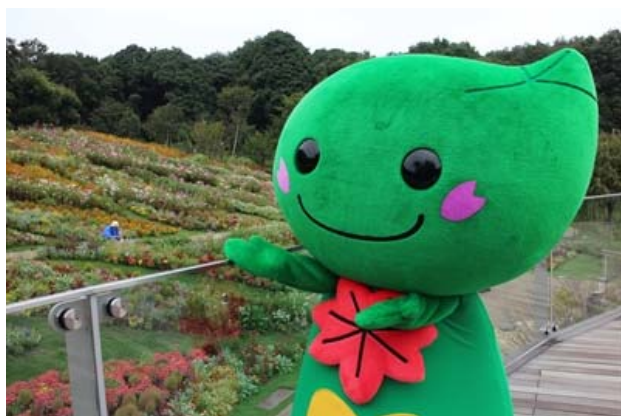
「ミドリンと花壇」

自然豊かな里山と、色とりどりの花々の織りなす風景を楽しめます。期間限定のイベントを実施していることもあります！