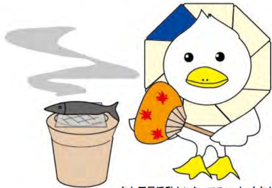
なか区民活動センターマスコット もなか

中区内の生涯学習・市民活動の参加を夢見て、様々な活動をされている人たちのための情報誌であり、多くの夢が生まれ皆に親しまれますようにと名づけられました。