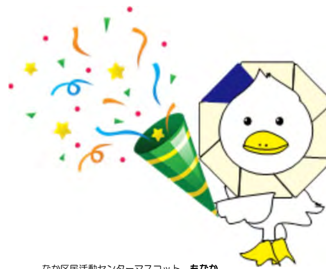
なか区民活動センターマスコット もなか