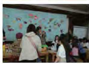
24年度フェスタの様子