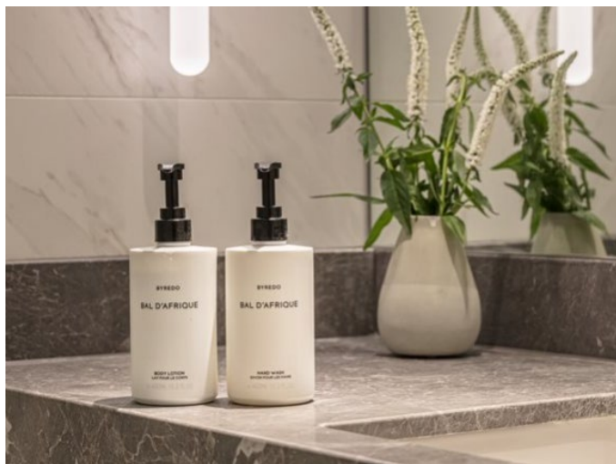
使い捨てバスアメニティをポンプ式大型ボトルへ変更