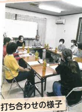
打ち合わせの様子