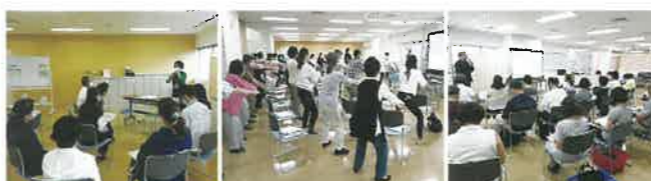
測定機器の使い方 運動 栄養・歯科

約6割の新任保健活動推進員が参加しました! 令和5年6月1日、6月22日、7月25日実施