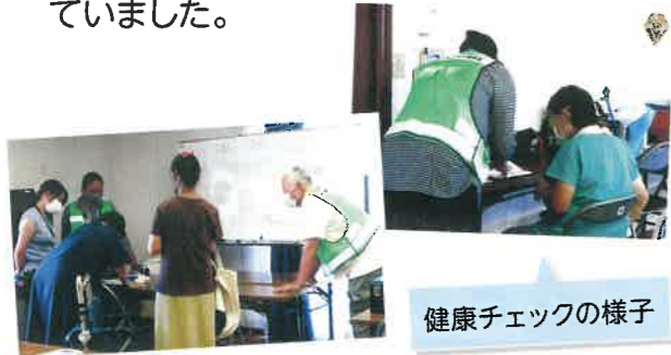
健康チェックの様子

令和5年9月5日上瀬谷住宅集会場で、健康チェック、手洗いチェックを実施しました。参加者は、手洗いの大切さを実感していました。