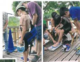
令和5年9月3日 子ども食堂