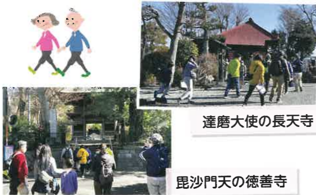
達磨大使の長天寺

令和5年2月11日に、「瀬谷八福神ウォーキング大会」を行いました。20名に満たない小規模の開催でしたが、特別参加の区役所の方2名も加わり、とても有意義な時を過ごすことが出来ました。