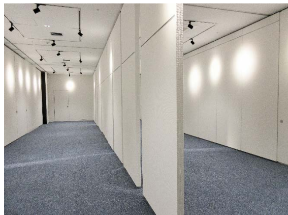
▶ 小規模な個展などを行う場合