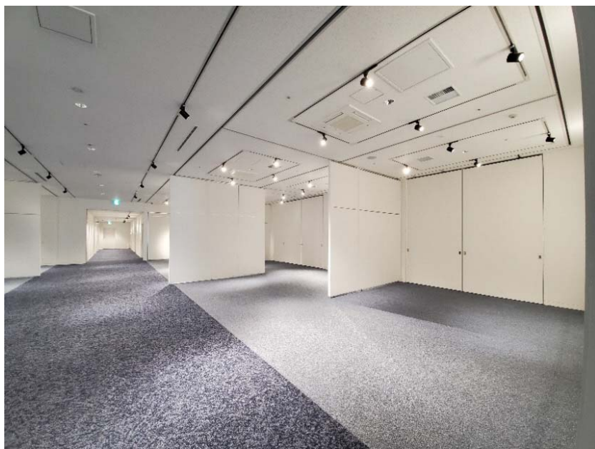
▲ 2室を一体で使用する場合 （通路の壁がない場合）