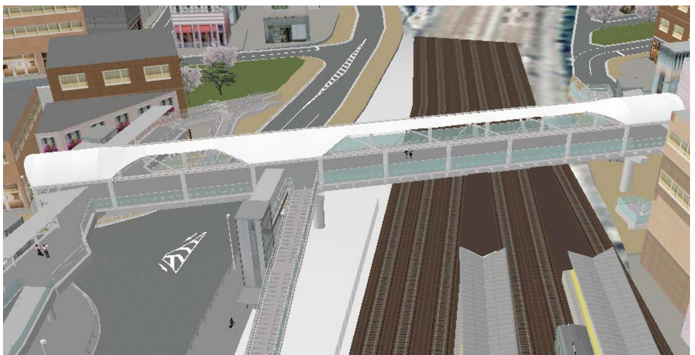
イメージ図 (戸塚駅側から横浜駅方面を望む)