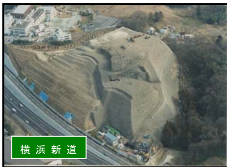
写真1 改善工事前の状況

特定産業廃棄物に起因する支障の除去等に関する特別措置法に基づく「戸塚区品濃町最終処分場に係る特定支障除去等事業（平成 20 年 2 月環境大臣同意）」については、平成 24 年度の完了に向けて実施していますが、同法の期限が延長されたことを受けて、事業期間の延長及び事業費の見直しを行います。