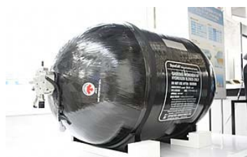
写真 1 繊維強化プラスチック複合容器