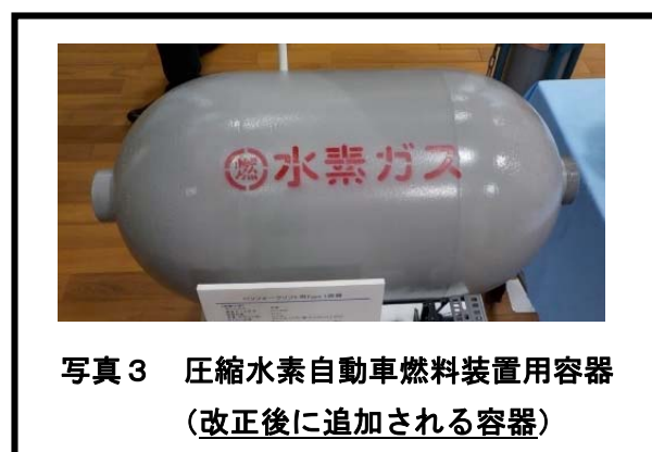
写真 3 圧縮水素自動車燃料装置用容器 (改正後に追加される容器)