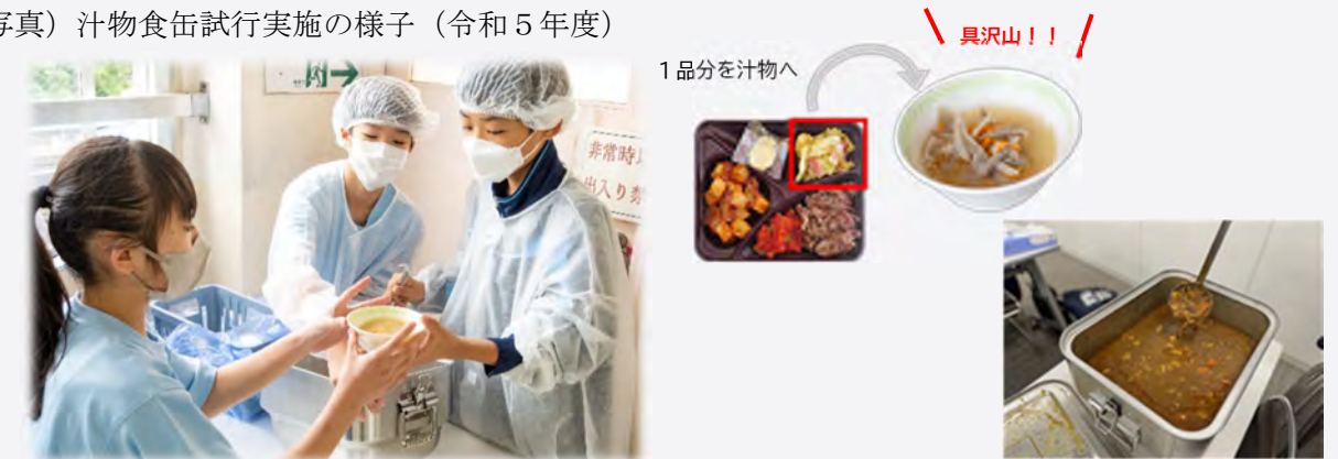
(写真) 汁物食缶試行実施の様子（令和5年度）

令和8年度に向けて中学校給食推進校の協力を得ながら、効率的な配膳方法や衛生管理、具沢山の汁物献立について、外部機関や 生徒の意見を聞きながら検討 してまいります。