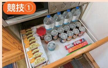
災害時に備えて備蓄をしましょう