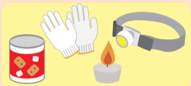
長期保存が可能なお菓子と 防災グッズなど ※実際の賞品と異なる場合があります

🕒 2月18日(土)①10時②13時③15時30分(各回約90分) ※内容は各回同じ。各家庭参加は1回まで。 🏠 区内在住か在学:各回先着150組 ※子どもがいる家族向け