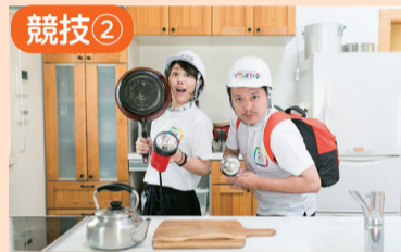
災害時のおうちの中での危険は?