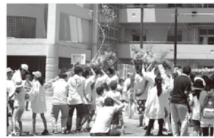
6月 蛇も蚊もまつり