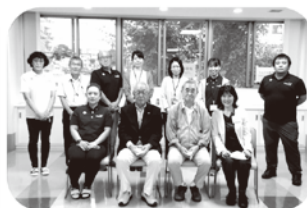
なまいちじゃん連絡会