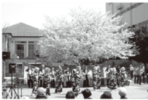
4月 さくらフェスティバル