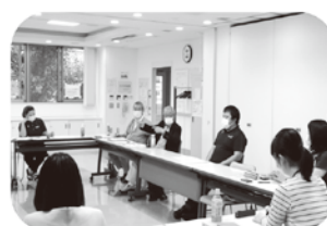
あいねっと懇談会