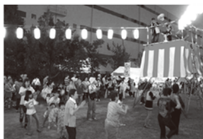
8月 生麦盆踊り大会