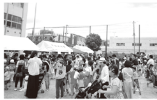
6月 子どもフェスティバル