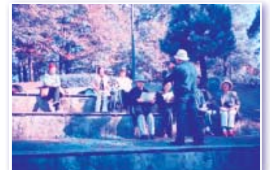
おしゃべりサロン・都筑中央公園にて