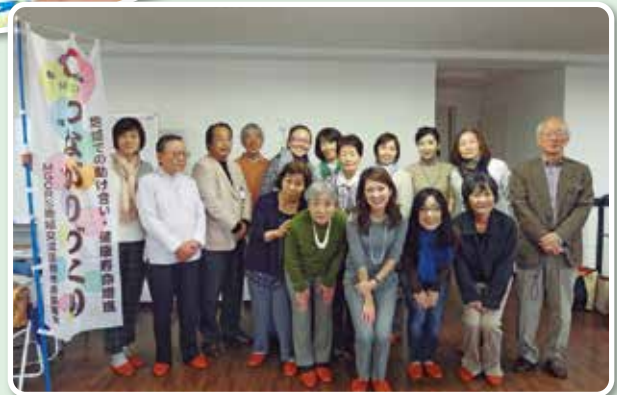
プチおしゃれ教室

「男の料理教室」では、料理が苦手な男性が自立を目指し、また、食を通して健康を考えます。「プチおしゃれ教室」では、女性も男性も楽しく外出するための、ちょっとしたおしゃれを学びます。