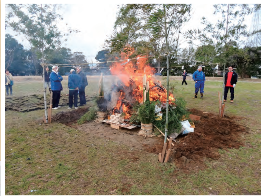
富士見が丘どんど焼き

地域の様々な活動などを通じて、人と人とのつながりや顔の見える関係づくりを進めています。地区全体で、地域のつながりや支え合いを大切にしています。