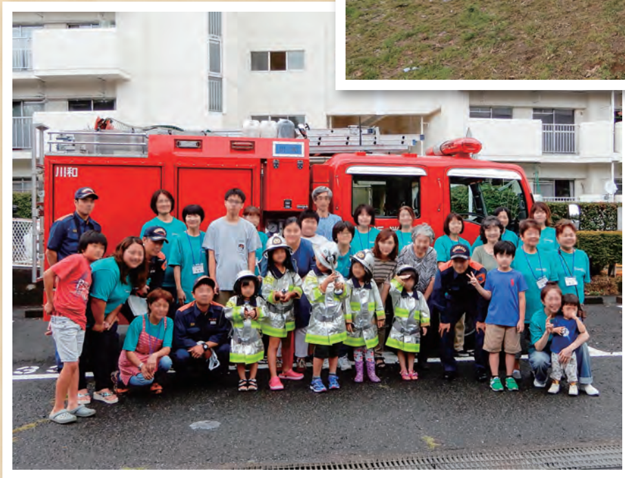
市営つづきが丘住宅防災訓練