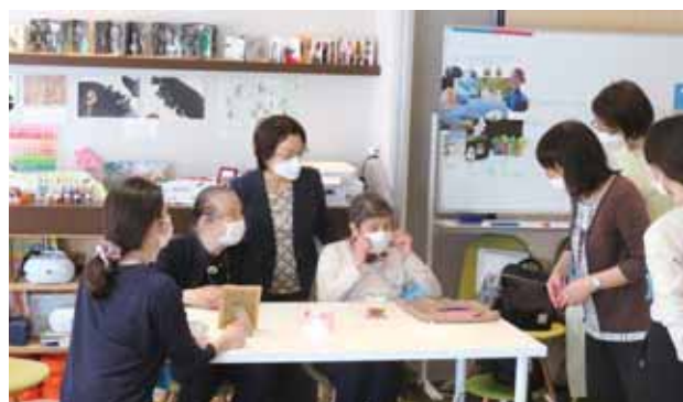
「アーモンド・カフェ〜スープの時間〜」では、楽しい活動と野菜スープストックランチを提供