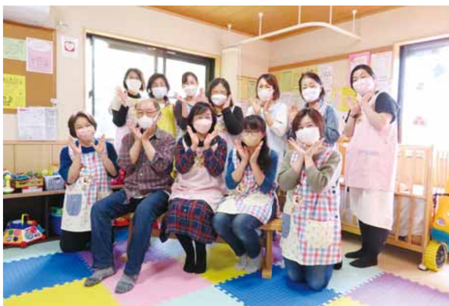
親と子のつどいの広場「すくすくサロン」のスタッフのみなさん