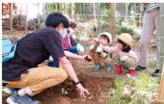
代表のご自宅の裏山で散策とたけのこ掘り体験