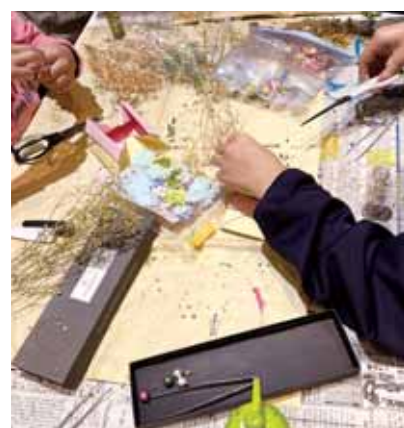
北山田と川和町で学び直しとアート制作活動等を実施しています