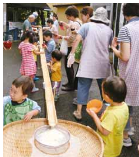
地元の自治会館で老人会のみなさんと流しそうめんを実施