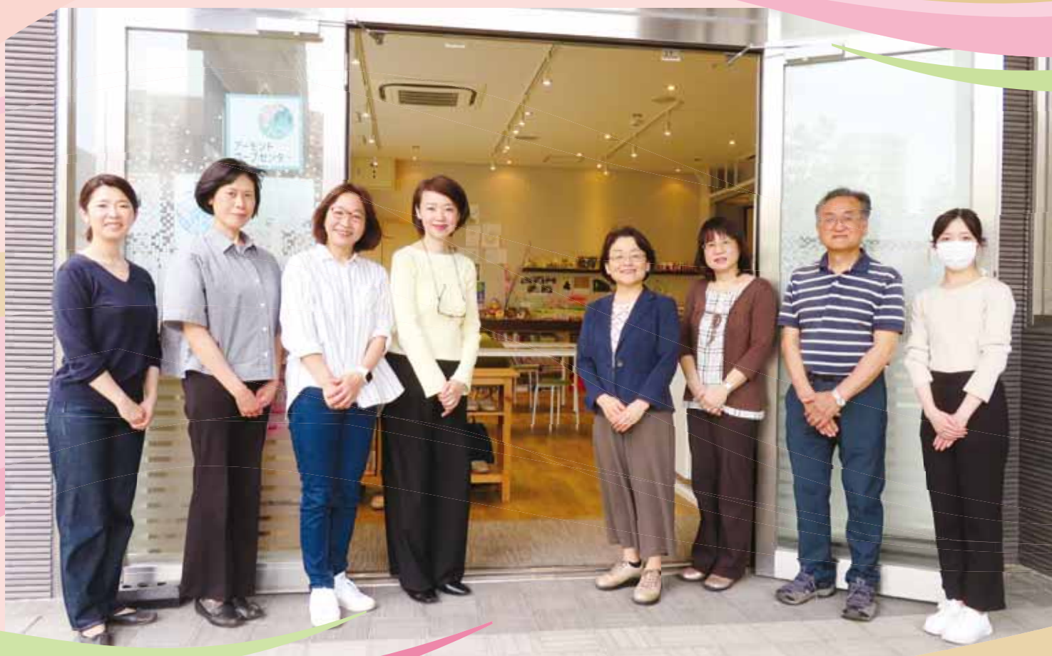
アーモンドコミュニティネットワーク:対話によるこころの支援を行うみなさん

都筑区では、様々なNPO法人が専門分野やテーマに 錨「ANCHOR 錨」を下ろし、地域課題に取り組んでいます。 彼らの活動の中での工夫やアイデア、自治会町内会等と協力して いる事例も含め、その魅力的な取組をご紹介します。