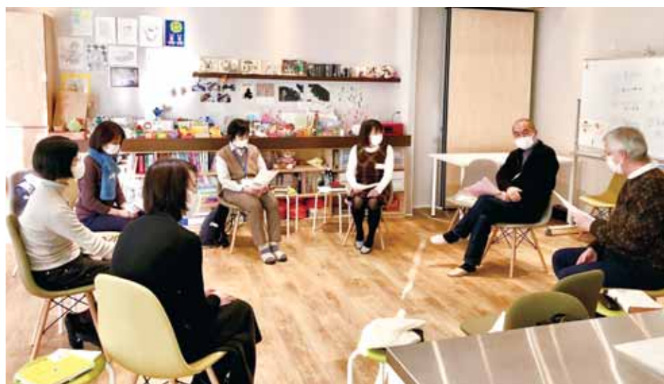
対話によるこころの支援を行うみなさんの傾聴勉強会の様子