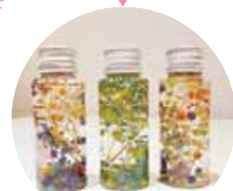
子どもたちと制作したハーバリウム